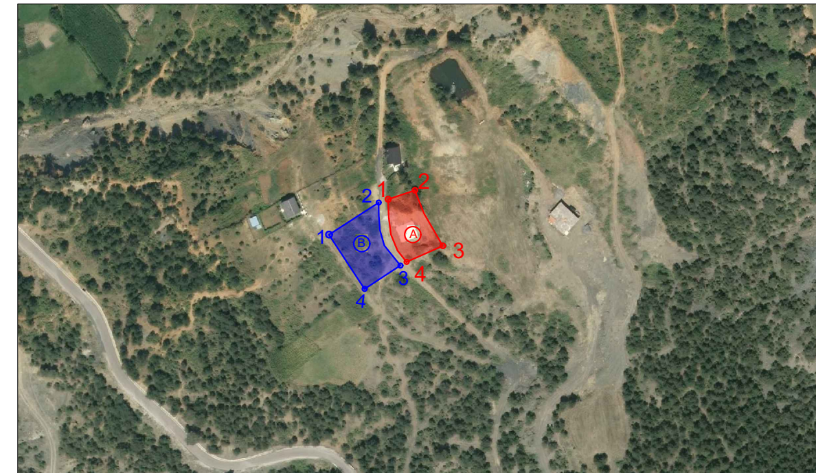
a description for your map.