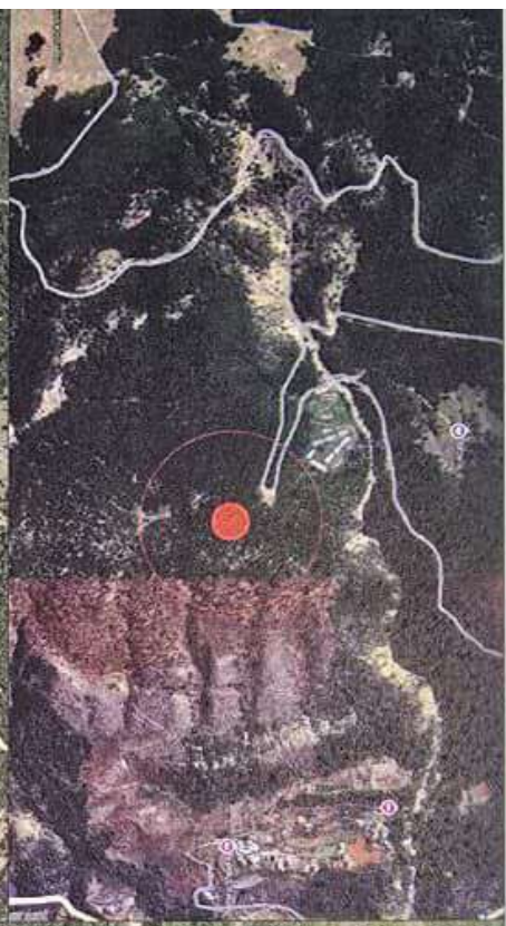
PRONA SIPAS GOOGLE MAPS : 2025

Digitally signed by Shpetim Myftari DN: cn=2025-02-01 22:34:17 +0200